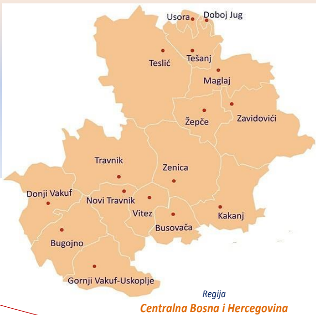
Regija Centralna Bosna i Hercegovina